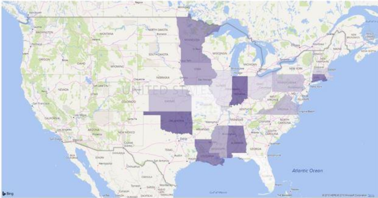
Exhibit 2: Distribution of Bond ETF Investments Designated as SV

Data as of Dec. 31, 2017. Chart is provided for illustrative purposes.